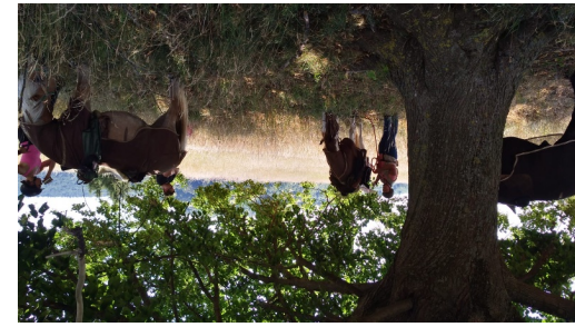
Schattiger Rasplatz