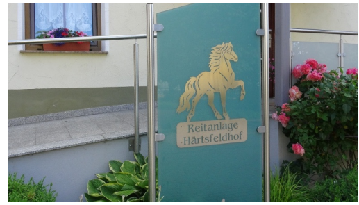
Härtsfeldhof WANDERREITEN RUND UMS RIES

3Tage Wanderreiten aufgrenzenlosen Härtsfeldhöheim GEO-Park Ries. Unterkunftsmöglichkeit mit Verpflegung für Roß & Reiter auf Wanderreitstationen. Start der Tour WanderReitbetrieb Hof Kranichau Ende der Tour WanderReitbetrieb Hof Kranichau