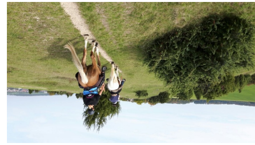
Juuhang WANDERREITEN RUND UMS RIES