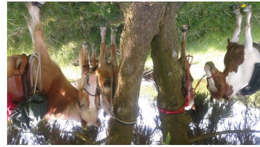
Pause Foto: Elke Ganser-Braun, WANDERREITEN RUND UMS RIES